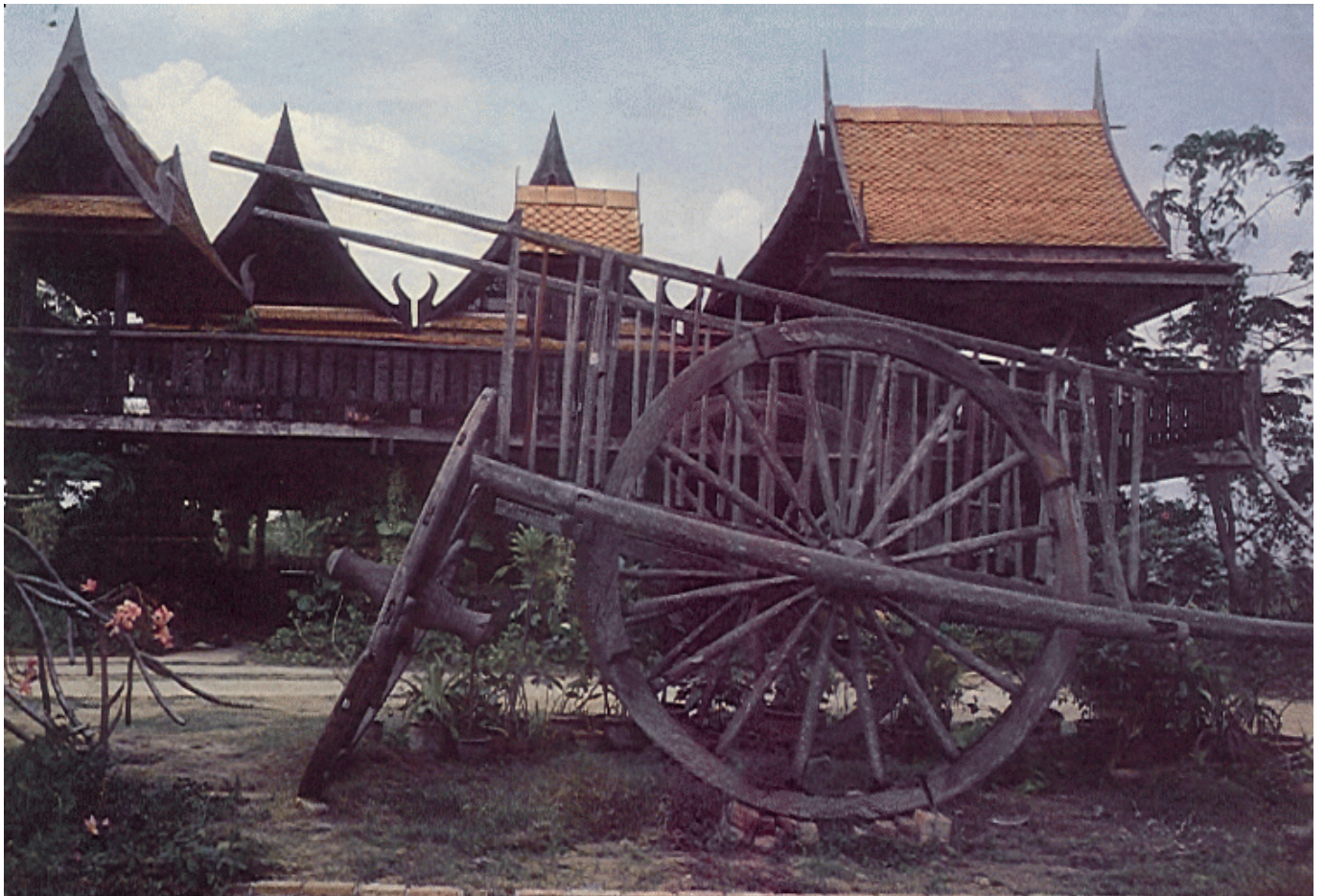
ละครฉากเปลี่ยนกรรมสิทธิ์ในบ้านทรงไทยจากกรรมสิทธิ์ร่วมเป็นกรรมสิทธิ์แต่เพียงผู้เดียวของหุ้นส่วนไทย

รายละเอียดเพิ่มเติมและสำนวนคำเบิกความในกรงวอชิงตันใน ปี ๒๕๔๗ ดูได้ จาก http://www.camblab.com/thai_02.htm